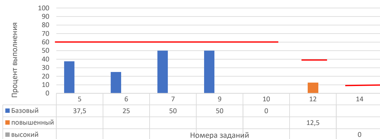
Рисунок 4. Задания, по которым участники не преодолели минимальный порог

На рисунке 4 представлены данные по заданиям (%), уровень выполнения которых не преодолел минимальный порог. Красной линией отражен минимальный порог выполнения для каждого уровня сложности: базовый – 60%, повышенный – 40%, высокий – 10%.