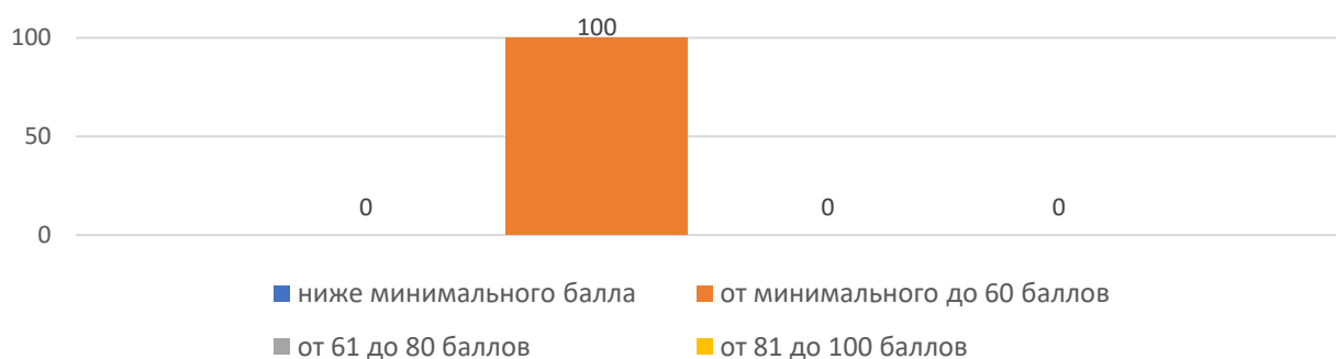
Рисунок 1. Основные результаты ЕГЭ по физике

Основные результаты ЕГЭ по физике в Тернейском муниципальном округе в 2023 году представлены на рисунке 1. В 2023 году в образовательных организациях (далее – ОО) муниципалитета не было выпускников, получивших на экзамене по физике 100 баллов.